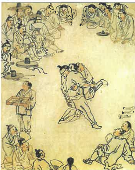
김홍도, '씨름' (18세기 후반)