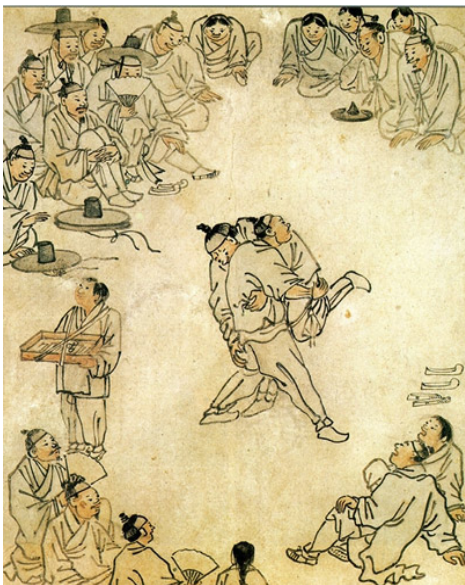
김홍도, ‘씨름’ (18세기 후반)