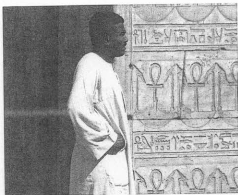
이집트의 전통 의상