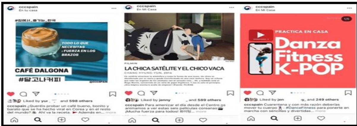
<스페인 SNS에서 화제가 된 '집에서 즐기는 한국' 시리즈.>

잡지는 "한국은 마이크로프로세서와 플라스마 스크린뿐만 아니라 활력(vitality) 과 매력(attraction) , 다양성(diversity) 으로 점철된(dotted) 문화산업을 수출한다"며 "세계 11위 경제 대국, 수출 규모 세계 6위인 한국의 위상을 부인할 사람은 아무도 없다"고 강조했다.